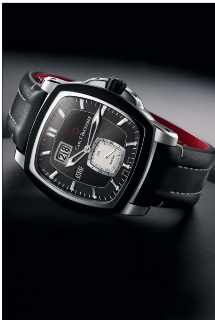
Die neue Patravi EvoTec DayDate von Carl F. Bucherer.