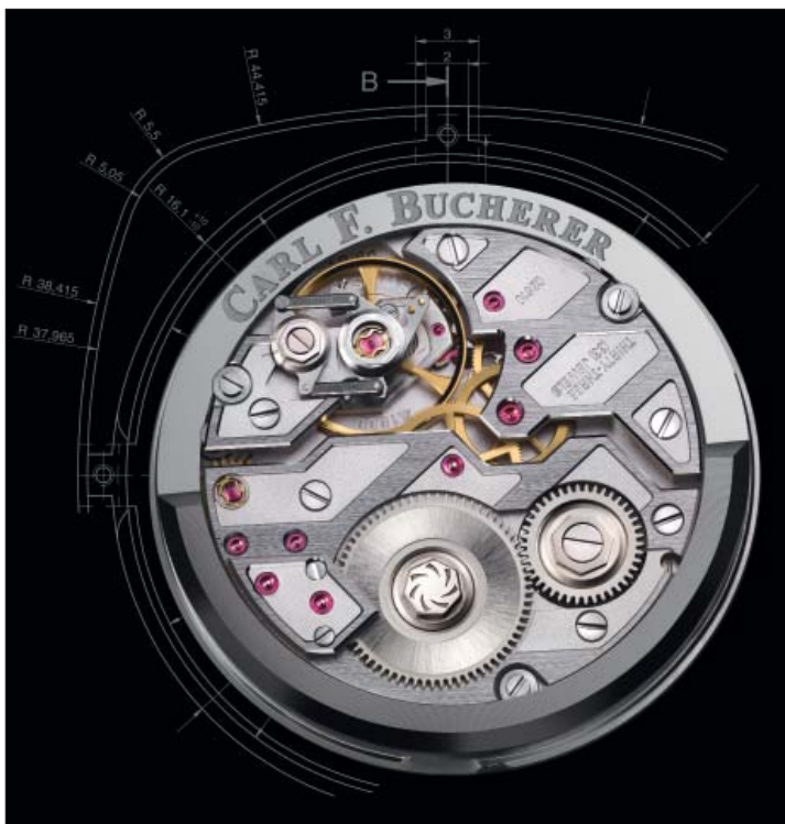
Revolutionäres Manufakturkaliber mit peripherem Rotor – das CFB A1000 von Carl F. Bucherer.

ein verworfen. Bald einigte sich das Team auf ein innovatives Automatikwerk mit exklusiven Baumerkmale. So entstand das Kaliber CFB A1000, Ausdruck einer Philosophie, die eine neue Ära ankündigt. Kreative Entwicklungen wie eine periphere Schwungmasse oder technische Neuerungen wie eine dynamisch dämpfende Stossicherung sowie